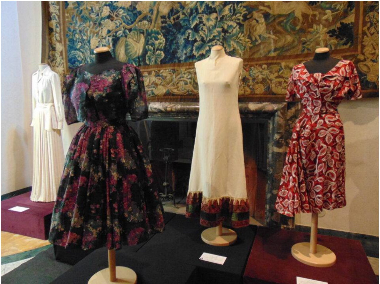
Vari abiti indossati da Palma Bucarelli tra cui uno da pomeriggio (a sinistra, seta avorio, opera della sartoria romana Gasbarri) e uno da cocktail (al centro, organza di seta nera e motivi floreali, opera della sartoria napoletana Cassisi)

Sembra quasi di vederla aggirarsi elegantemente durante gli eventi e le inaugurazioni, avvolta da meravigliose stoffe sapientemente cucite e ricamate, di seta liscia oppure orientaleggianti, coordinate con gioielli, a volte futuristici, ma originali e ben abbinati.