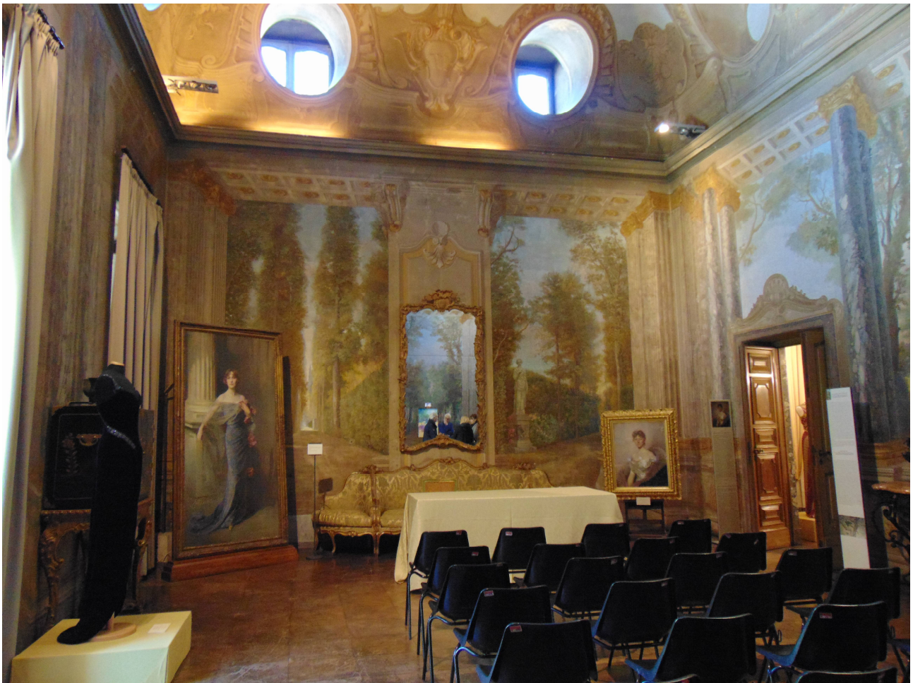
Museo Boncompagni Ludovisi, Salone delle Vedute