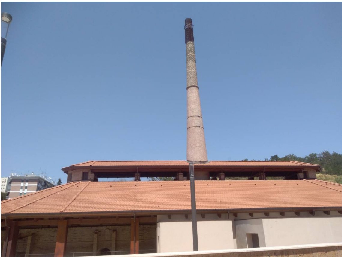
Dettaglio della fornace appena restaurata (23.07.2020)

Non era solo la zona che conosciamo come “Valle Aurelia” ad essere costellata dai fuochi sempre accesi delle fornaci, tanto da farle assumere popolarmente il nome di Valle dell’Inferno. Tutta l’area che sorgeva intorno al Vaticano, da via delle Fornaci (appunto), alla Valle del Gelsomino (area compresa tra via Aurelia Antica e via Gregorio VII) era puntinata di un rosso scarlatto e di colonne di fumo.