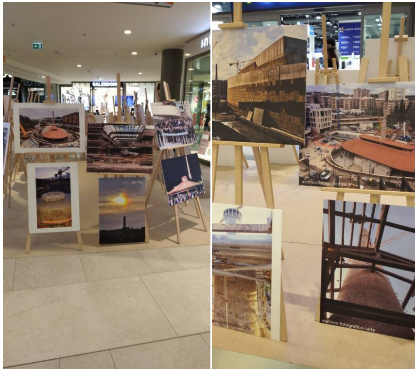
Immagini della mostra di foto storiche svoltasi presso i locali del Centro Commerciale AURA nel mese di ottobre 2021

Questo era il luogo di produzione dei mattoni, un'area industriale, rurale, povera, attorno a cui si sviluppò il borghetto dei fornai, composto dalle abitazioni degli operai, e dove sorsero anche le famose baracche presenti ancora fino agli anni Settanta del secolo scorso. Le foto storiche, alcune delle quali esposte presso il Centro Commerciale AURA nel mese di ottobre 2021, oppure presso la Biblioteca Casa del Parco nel mese di giugno 2022 (Mostra "Centaurelio"), lo dimostrano.