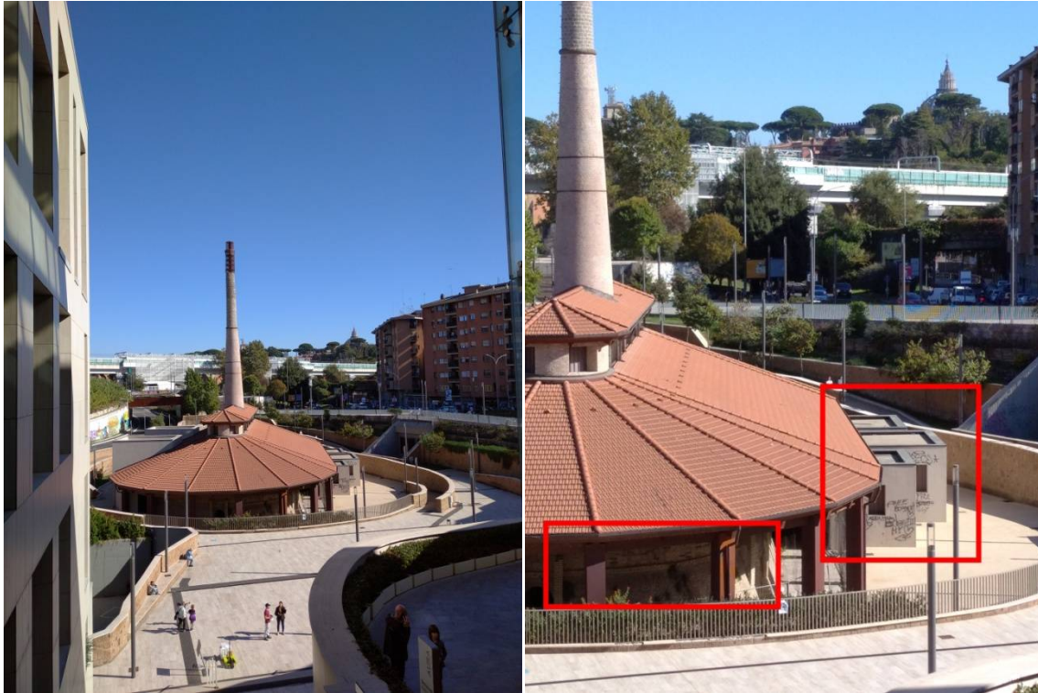
Fornace Veschi, ottobre 2022. Nei riquadri rossi sono visibili alcuni segni di vandalismo

All'esterno, in un'intercapedine, si intravede una tenda azzurra; i muri bianchi sono ricoperti di scritte nere senza senso; la fornace è stata internamente violata, vandalizzata, e solo di recente sono state poste alcune inferriate a causa delle frequenti intrusioni dei suddetti soggetti. Ma se ciò non bastasse, è opportuno riflettere su alcuni aspetti annessi alla situazione.