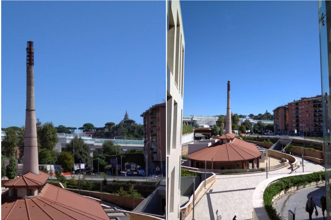
Fornace Veschi, post restauro, settembre 2020

Nonostante la fornace Veschi fosse stata totalmente abbandonata a partire dalla cessazione delle attività, presentandosi quindi in avanzato stato di degrado, venne restaurata, qualche anno fa, a spese della società proprietaria del Centro Commerciale AURA. L'impianto, che avrebbe dovuto proporsi come centro polifunzionale a carattere culturale, è diventato invece un centro di aggregazione di baby gang, alloggio per sbandati e piazza di spaccio tra i più giovani. Tutto questo si svolge in pieno giorno e, nonostante le denunce ai Carabinieri e gli arresti avvenuti in passato, il fenomeno prosegue.