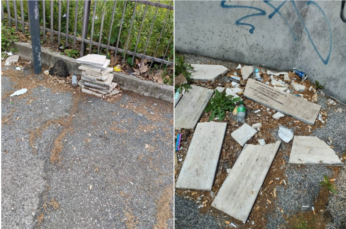
Dettagli dei marmi divelti e della condizione di degrado alla fermata bus “Valle Aurelia”, aprile 2023

Il Monte Ciocchi, che pure è stato riqualificato pochi anni fa e prevede un percorso che si inerpica fino in cima, tornando ad essere uno spazio verde per gli abitanti del quartiere, diventa inavvicinabile appena calano le tenebre. Eppure non parliamo di “Gotham City”: siamo a pochi passi dal Vaticano, la cui cupola è ben visibile.